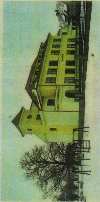
OPRAVENÁ BUDOVA bývalé obecní školy v Ledcích.

Úpravami má projít také hrací zahrada pro mateřskou školu a část odpočinkové zahrady, která bude sloužit především nájemníkům pěstovatelského domu. „I na toto máme schválenou dotaci, tak věřím, že se vše zdárně podaří,“ okomentoval starosta. Rozárium a vylepšování zahrady se mělo odehrát již v loňském roce. Přípravné práce však výrazně zpomalil covid-19. Když obec vyhlásila výběrové řízení na zhotovitele, tak se zprvu nikdo moc nehlásil kvůli odlivu zahradařských dělníků. „Když do stávám otázku, co se mi za více než 20 let starostování povedlo a na co jsem pyšný, odpovět je jednoduchá, prá-